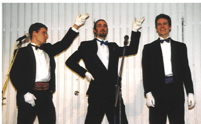
(billede fra festivalen 1999, fra hjemmesiden)