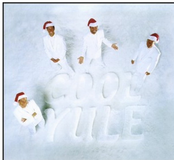
Texaskvartetten ACOUSTIX', 1991: The New Science Of Sound er en af de få skiver

Det er meget inspirerende for en søgende vokalist at lytte til gode vokalgrupper og deres CDer. Men det kræver lidt anstrengelser og held at få kendskab til udgivelserne. Showsang i almindelighed og barbershop i særdeleshed spilles kun meget sporadisk i radio og fjernsyn. Og det fylder alt for lidt i musikbutikker og biblioteker. Imidlertid findes der på nettet et virtuelt supermarked for vokalmusik. Det hedder Primarily A Cappella og kan besøges på hjemmesiden www.singers.com . Her kan du for eksempel købe SPEBSQSA's CDer med årets bedst placerede kvartetter og kor - med eller uden nodehæfte. Disse skiver giver en god introduktion til barbershoppens aktuelle frontfigurer og det er forfriskende at klangen ændrer sig fra sang til sang.