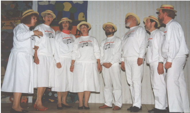
Hillerød Barbershop 1993

Beslutningen om at danne Dansk Barbershopforening blev truffet ved 2. festival, og efter et forarbejde blev foreningen stiftet i ved 3. festival i 1994. Den første bestyrelse med undertegnede som formand bestod af sangere fra Oktetten, Lyng Barbershop, Bill's Mothers, Sleazy Sisters og Skinger Singers. Derefter overtog Dansk Barbershopforening at arrangere den årlige festival.