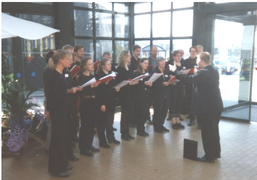
Unoderne, optræder i slotsarkaden før festivalen 2000