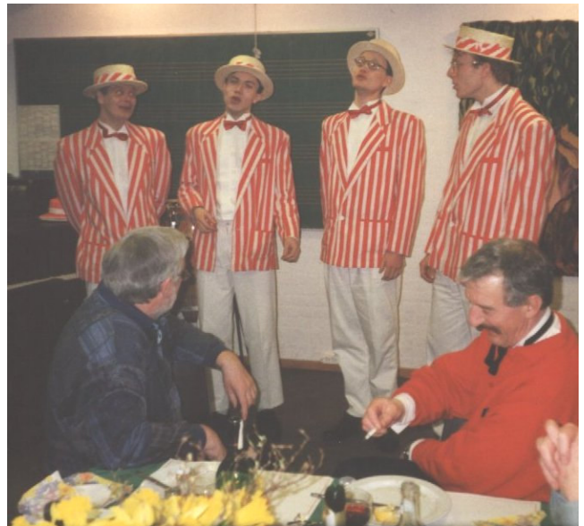
Bills Mothers 1994

aktivitet, største trækplaster og største inspiration. Den brede kontakt til sanggrupper og kor landet over, som vi har opnået gennem festivalerne, har gennem årene været grundstammen i Dansk Barbershopforening som landsforening.