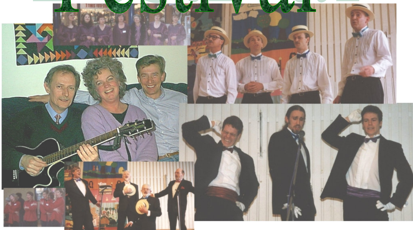
Bar'Piger, Air Male, Bedre halvdel, The Barbars, Soundisfaction og Fourtune.