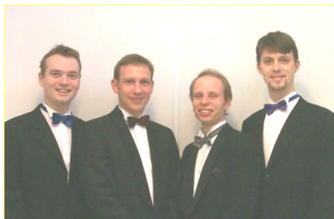
Close Harmony har fået hjemmeside www.closeharmony.dk

Cocktail , kvindekvarteret i Københavnsområdet, afholdt i december en offentlig koncert med spisende publikum på restauranten.