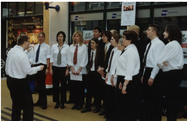
Unoderne synger i deres friske gadedrenguniform i Slotsarkaderne.

Med sin faste dirigent, Peter Salwin, med sine dygtige sangere og med et regelmæssigt prøveforløb har koret udviklet sit repertoire og sin sangstil. Koret har optrådt både privat og offentligt, sidst ved Festival 2001.