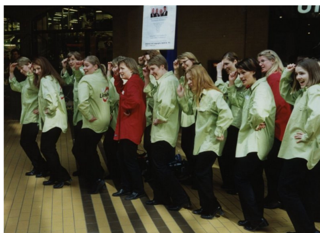
Malmö Limelight Chorus i topform i arkaden