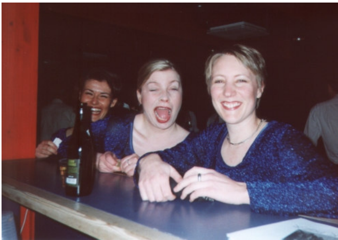
Vore svenske gæster var tilfredse med baren.

Festen fortsatte med det sidste tog mod København hvor den stod af og gik på Jazzhouse for at få de sidste stråler af rampelyset fra Malmö. Hvornår har du sidst danset med dine sangvenner?