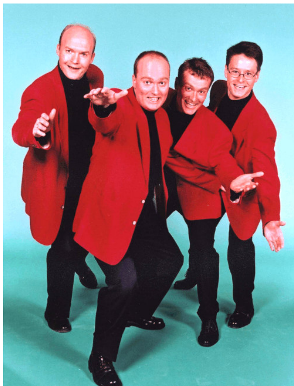
Pure Voices, Herning. DKs førende i barbershop.

Lørdag-søndag den 6.-7. april 2002 i Hillerød