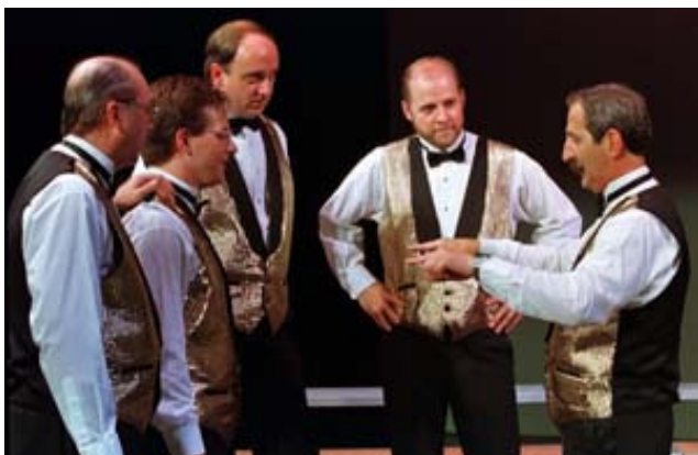
Coaching er turbo på gruppens kunstneriske udvikling