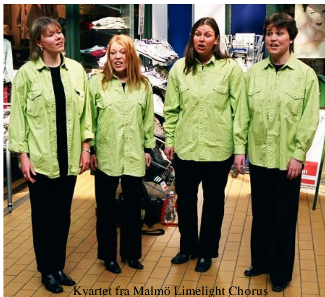
Kvartet fra Malmö Limelight Chorus