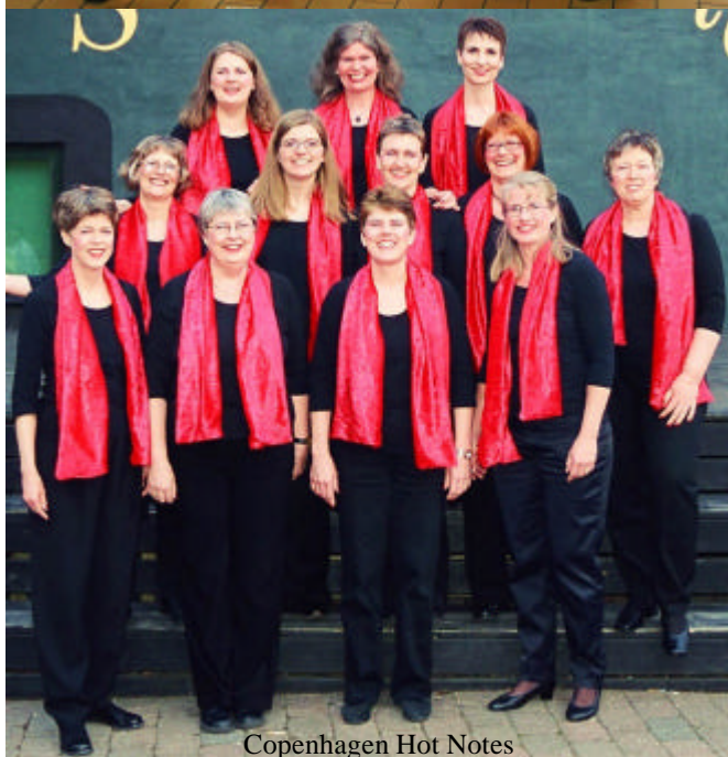
Copenhagen Hot Notes