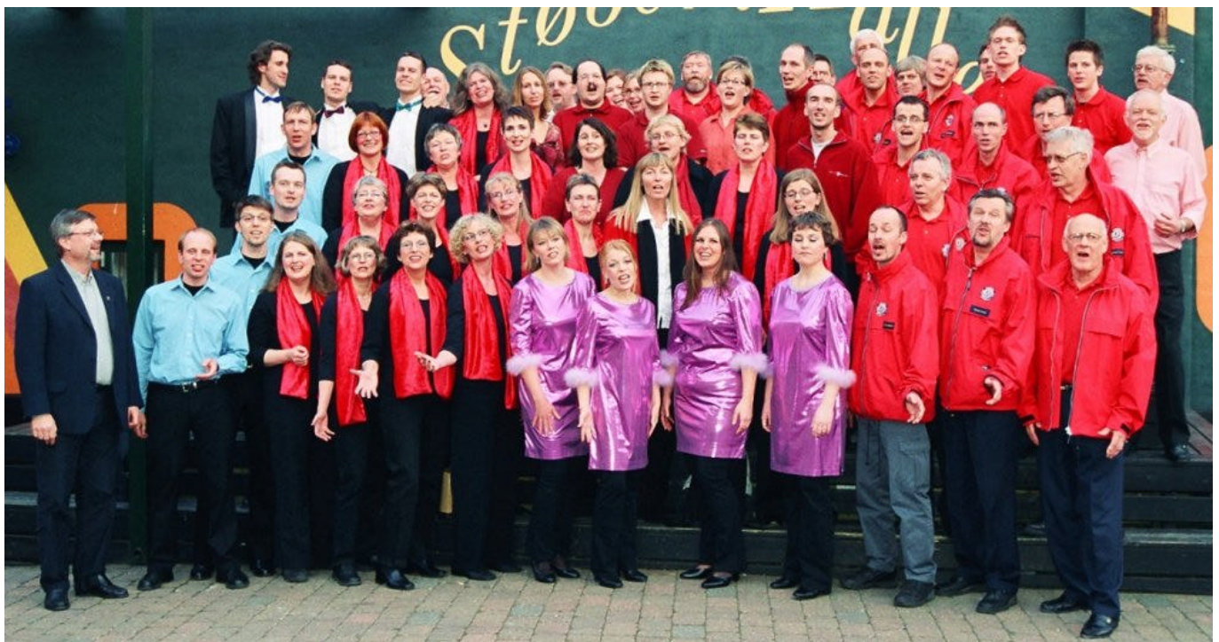
Fællesbillede festivalen 2003