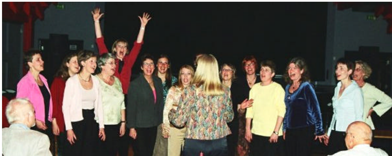
Copenhagen Hot Notes mfl.

Det kammeratlige højdepunkt var som sædvanlig festen om aftenen, hvor vi beværtedes med en festmiddag - en buffet, der i år var serveret af "Støbeskeen", den restaurant der er knyttet til Støberihallen.