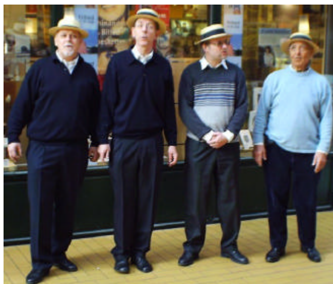
Nice Try i Slotsarkaden

Desværre var der ikke arrangeret optagelse af koncerten. Med henblik på at afgøre, om vi kan være bekendt at melde os til næste år, ville det være rart at vide, hvorledes vi lød sammenlignet med de øvrige grupper optaget under identiske omstændigheder.