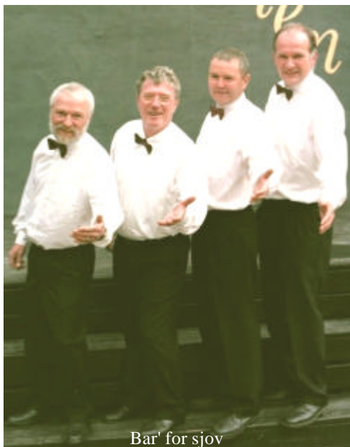
Bar' for sjov