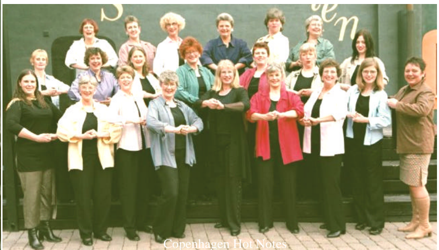
Copenhagen Hot Notes